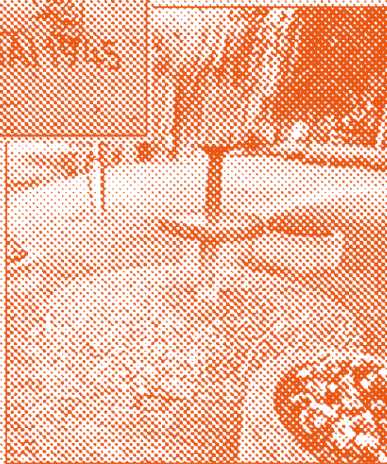
Monument Veldweg Doornspijk