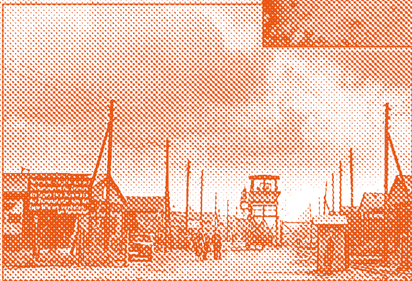
Buitenkamp Sandbostel, oktober 1942